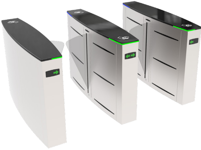
Opsiyonel kayar asteroid indikatörlü üst kapak