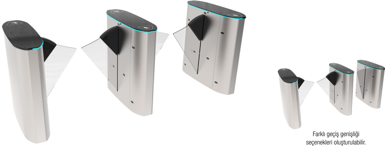
Farklı geçiş genişliği seçenekleri oluşturulabilir.